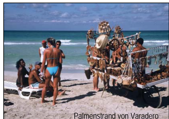
Palmenstrand von Varadero

Den Vormittag genießen wir noch am Palmenstrand. Am Nachmittag Transfer zum Flughafen Havanna und Rückflug mit Iberia oder anderer IATA-Fluglinie via Madrid (vorauss. Flugzeiten: Havanna – Madrid 22:50 – 14:00)