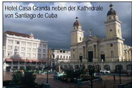
Hotel Casa Granda neben der Kathedrale von Santiago de Cuba

Den ganzen Tag verbringen wir in der Hauptstadt des Oriente: Panoramatour mit der historischen Moncada Kaserne, Revolutionsplatz, Friedhof Santa Iphigenia, Besuch der Festung El Morro mit einem beeindruckenden Blick auf die Hafeneinfahrt Santiagos. Am Nachmittag bleibt uns in der Stadt Zeit zur freien Verfügung. Nächtigung im Kolonialhotel Casa Granda***